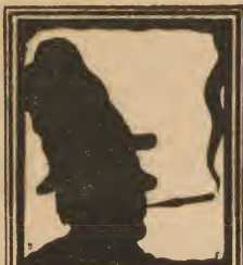
V. STOCKER ZIGARRENHAUS MÜNCHEN SENDLINGERSTR. 27

JULIUS PATLOKA, MÜNCHEN Fürstenstrasse 6 / Telefon 26778 Damen-Moden Spezialität: Elegante Kostüme | Mäntel | Kleider usw.